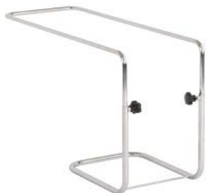
Table de lit

CHF 30.– par mois CHF 1.– par jour Taxe de base CHF 15.– Achat CHF 229.60